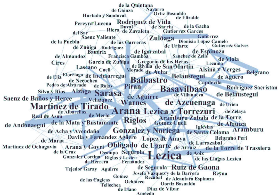
FIGURA 3. RED DE FAMILIAS CAPITULARES DE BUENOS AIRES CON ETIQUETAS A ESCALA DE LA CENTRALIDAD DE GRADO (1776-1810)

Fuente: Elaboración propia con base en datos recolectados por los autores.