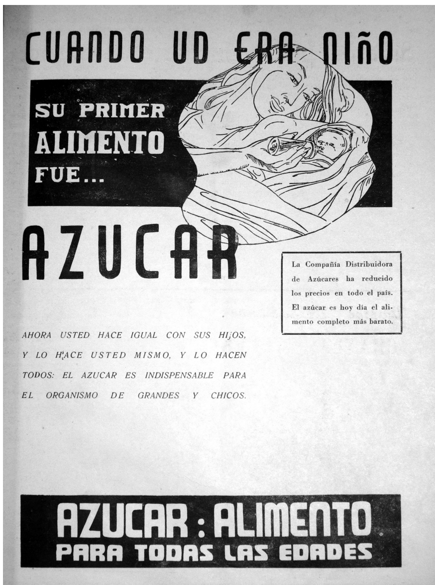
IMAGEN 1. PROPAGANDA PARA INCREMENTAR EL CONSUMO DE AZÚCAR