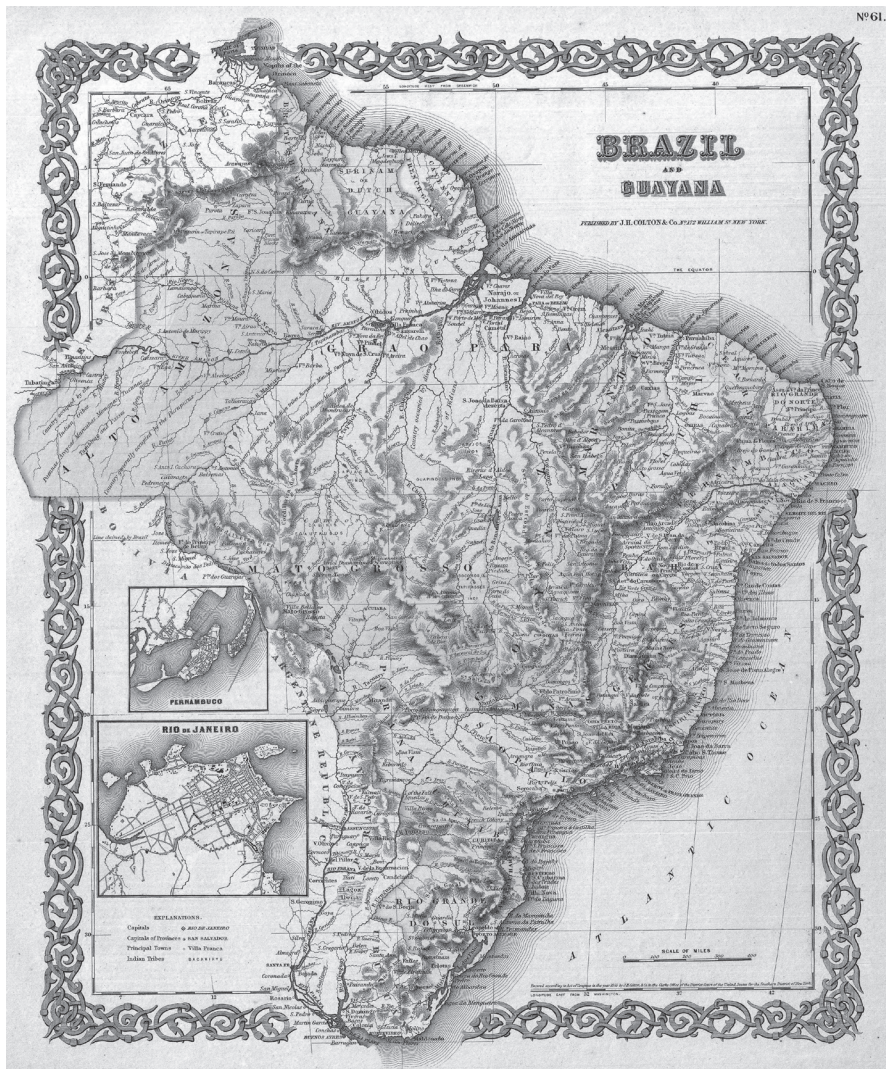
MAPA 1. BRASIL POLÍTICO, 1855

Nota: as províncias do Amazonas e Pará são as duas grandes regiões no norte do país.