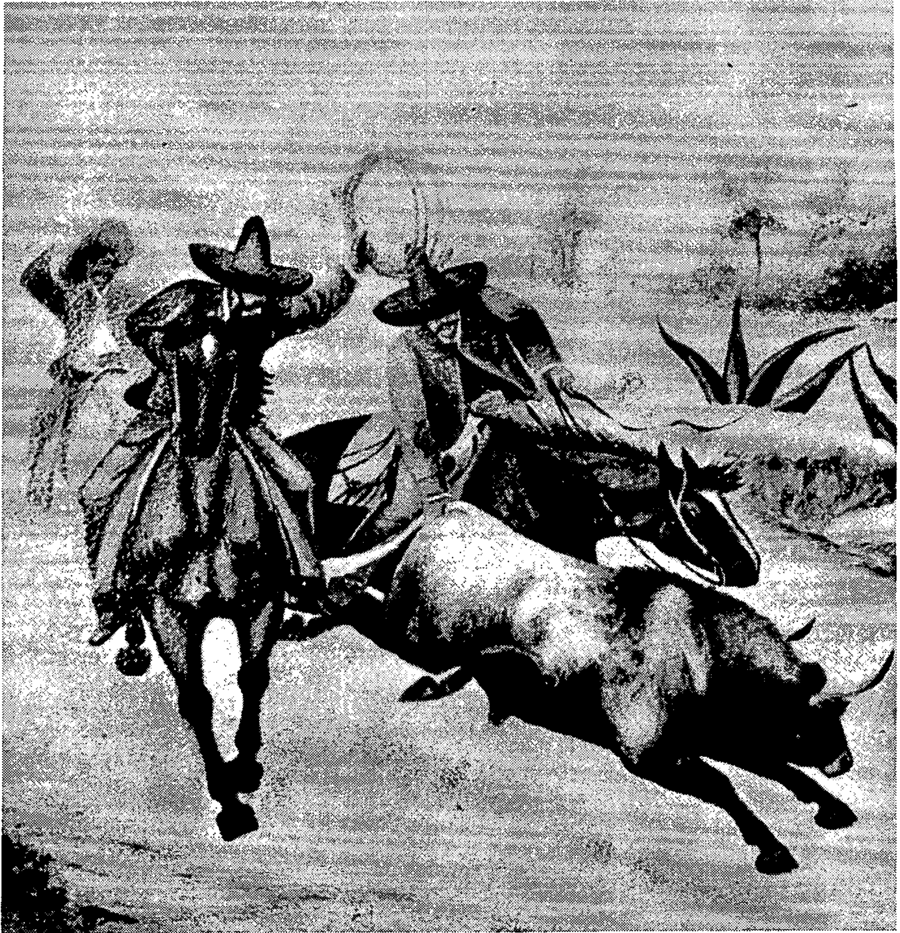
Tomado de Revista Artes de México , vol. v, núm. 26, año vii, 1959, p. 34.