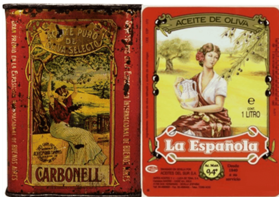
Ilustración 5. Lata de la década de 1910 de Carbonell y etiqueta de La Española (circa 1990)