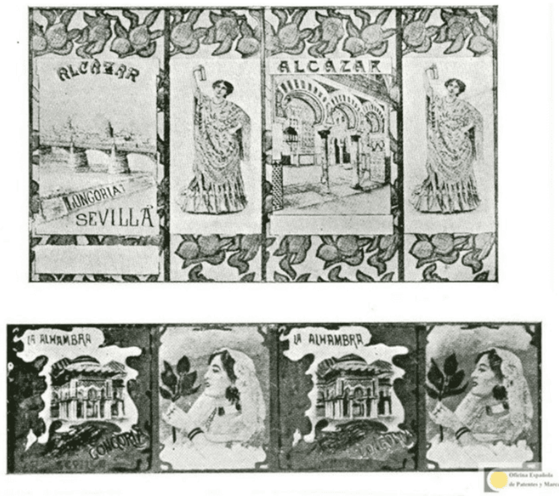
Ilustración 2. Litografías para las latas de aceite de oliva Alcázar y La Alhambra (1904)